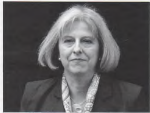
Тереза Мей, Прем'єр-міністр Великобританії