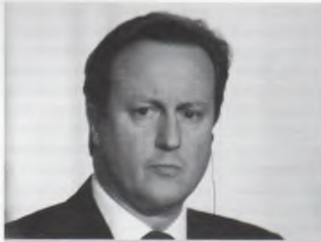
Девід Уільям Дональд Кемерон, Прем'єр-міністр Великобританії 2010-2016 рр.

В тлумаченні Д. Кемерона ключовий принцип діяльності ЄС зводився до того, що «Європа діє там, де це необхідно, а національні органи – там, де це можливо», що суцільно заперечувало плани федералістів щодо створення європейської наддержави. Й хоча інші європейські лідери утримувалися від публічних обіцянок переглянути установчі договори на угоду вимогам британського уряду, Д. Кемерон стверджував, що таке положення вже схвалено, й натякав про бажання переговорів, спрямованих на зміцнення британського суверенітету. Оцінюючи досягнутий компроміс, важливо відзначити, що укладена угода мала набутти юридично зобов'язуючого характеру, однак лише в разі позитивного результату референдуму про членство Об'єднаного Королівства в ЄС. З точки зору британських урядовців «особливий статус» мав гарантувати країні суттєві пільги в фінансово-економічній галузі. Поряд із участю в європейському спільному ринку та можливістю використовувати угоди про вільну торгівлю та економічні преференції з понад 50 країнами світу досягнутий компроміс дозволяв зміцнити потенціал лондонського фінансового, біржового та інвестиційного центру й гарантував значну автономію в міграційній, валютно-фінансовій та соціальній політиці. На певному етапі навіть здавалося, що Лондон відіграватиме активнішу роль у розробці європейських реформ у сферах конкуренції, соціальної політики та еконо-