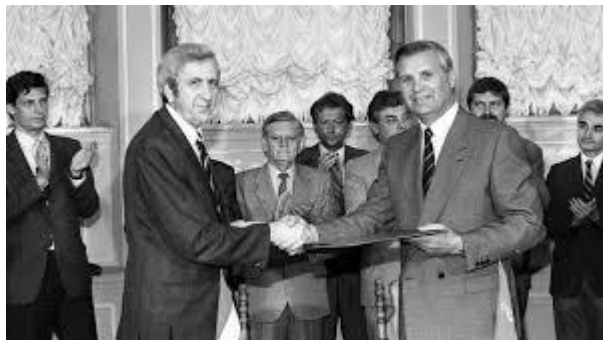
Візит Гези Єсенського Міністра закордонних справ Угорщини до Києва 27–28 травня 1992 р. Обмін Протоколом про консультації між міністерствами закордонних справ.

Після завершення першого терміну в 1994 р. Зленко не полишив дипломатичну службу. Він обіймав посаду Постійного представника України при ООН (1994–1997), де активно просував інтереси країни в цій ключовій міжнародній організації. Згодом, як Посол України у Франції (1997–2000), він також повернувся до роботи з ЮНЕСКО, зміцнюючи культурні та дипломатичні зв'язки. У 2000 р. Зленко вдруге очолив МЗС України (до 2003 р.), повернувшись до керівництва в період, коли країна потребувала стабілізації зовнішньої політики після економічних і політичних потрясінь кінця 1990-х рр.