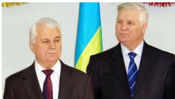
Л.М. Кравчук та А.М. Зленко, 1994 р.

Після завершення першого терміну в 1994 р. Зленко не полишив дипломатичну службу. Він обіймав посаду Постійного представника України при ООН (1994–1997), де активно просував інтереси країни в цій ключовій міжнародній організації. Згодом, як Посол України у Франції (1997–2000), він також повернувся до роботи з ЮНЕСКО, зміцнюючи культурні та дипломатичні зв'язки. У 2000 р. Зленко вдруге очолив МЗС України (до 2003 р.), повернувшись до керівництва в період, коли країна потребувала стабілізації зовнішньої політики після економічних і політичних потрясінь кінця 1990-х рр.