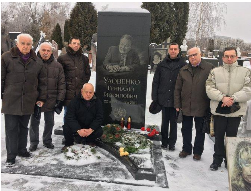
На могилі Г. Удовенко. Українські дипломати, 2015 р.

Геннадій Удовенко помер 12 лютого 2013 р. на 82-му році життя, залишивши після себе велику спадщину в політичній та дипломатичній діяльності незалежної України [5].