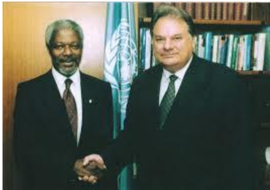
Г. Удовенко і Кофі Аннан, 1997 р., Нью-Йорк

У 1997 році Геннадій Удовенко був обраний президентом 52-ї сесії Генеральної Асамблеї ООН, що стало важливим досягненням для України. Це було свідченням високої міжнародної репутації українського дипломата, адже його обрання було результатом підтримки та визнання з боку міжнародного співтовариства. Під час своєї каденції він активно працював на зміцнення міжнародної безпеки та прав людини.