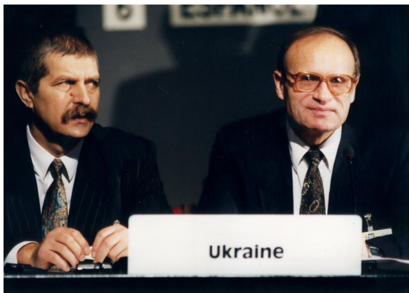
А.Д. Бутейко та Д.І. Ткач на засіданні Дунайської комісії, 1994 р.

Визначним етапом у дипломатичній кар'єрі А. Бутейка стало призначення його Надзвичайним і Повноважним Послом України в Сполучених Штатах Америки та Мексиці (1998-1999 рр.). На цій посаді він доклав значних зусиль для розвитку стратегічного партнерства між Україною та США, активно працював над залученням американських інвестицій та підтримки реформ в Україні.