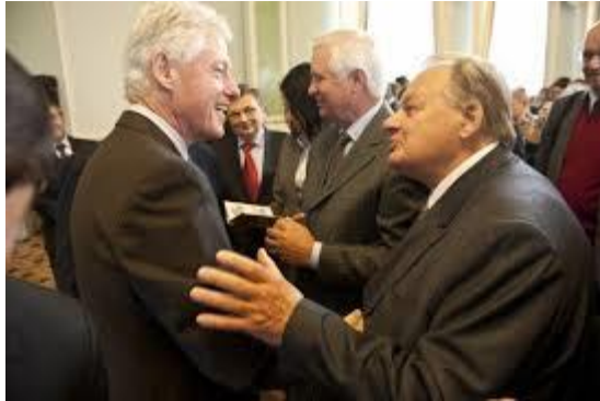
Г. Удовенко та Б. Клінтон, березень 1994 р., м.Київ

Цей документ став ключовим в історії України, оскільки він гарантував територіальну цілісність країни після відмови від ядерної зброї, яку Україна успішно реалізувала, ставши частиною міжнародної ядерної безпеки. Меморандум був підписаний між Україною, США, Великою Британією та Росією, і в ньому ці держави зобов'язувалися поважати суверенітет та кордони України, а також утримуватись від застосування сили або погрози силою. Це було важливе досягнення, яке закріпило міжнародні гарантії безпеки для України в той час, коли країна лише починала розбудовувати свою зовнішню політику після здобуття незалежності.