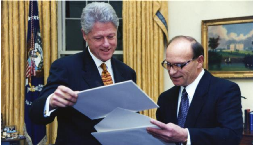
Президент США Б. Клінтон та А. Бутейко, 1995 р.

та приєднання до ДНЯЗ була ключовою. Антон Бутейко зробив вагомий внесок у формування концептуальних засад зовнішньої політики незалежної України. Він був одним із авторів перших стратегічних документів, що визначали зовнішньополітичний курс держави, включаючи «Основні напрями зовнішньої політики України» (1993 р.) [3].