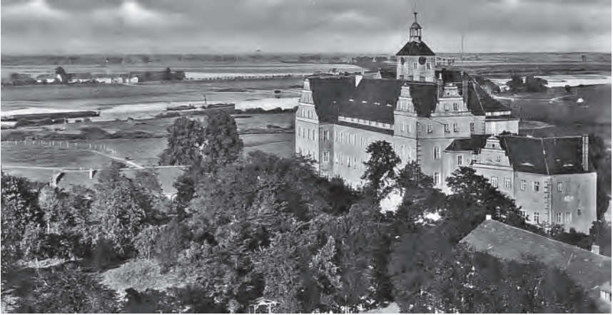
Замок в Претцше-на-Эльбе, в котором находилась школа пограничной полиции

в Претцше. Командиром в то время был штандартенфюрер Дангело 1 . Хэфнер, после того как он отбыл срок своей службы, пришел туда потому, что он служил в СС «Дойчланд», если я правильно помню, то есть в полку войск СС. Он был придан мне лично в качестве инструктора и руководителя инспекции для текущих тогда курсов учащихся пограничной полиции. Хэфнер был тогда гауптшарфюрером СС. Я полагаю, что он в то время был служащим крипо 2 , как и я сам. В этой школе в мои обязанности входило вышеназванное руководство инспекциями. Курсы были разбиты на отдельные инспекции или классы. Я одновременно осуществлял и руководил войсково-полицейским обучением и оружейно-технической подготовкой. Для этого мне был придан Хэфнер... Хэфнер был солдатом душой и телом. Именно поэтому он вступил и в СС «Дойчланд». Он был очень искусным тактиком в войсково-полицейском обучении, как в практике, так и в оружейной технике. Он был очень корректным руководителем инспекции. В его инспекции всё получалось стопроцентно. У него никогда не было никаких особых происшествий. Он был абсолютно порядочным и честным человеком. Я не