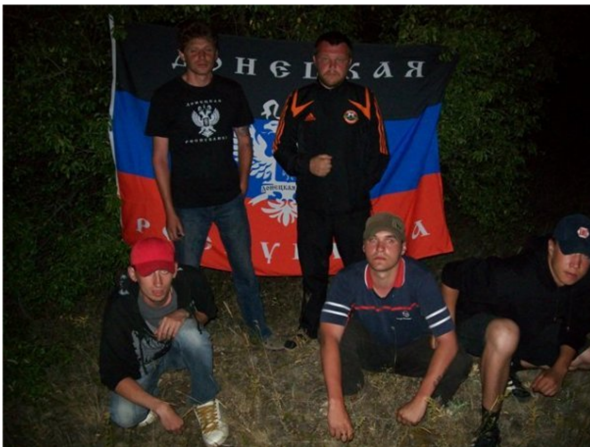
Фото из социальной сети с символикой «Донецкой Республики» (еще не «народной»), датированное 12 августа 2009 г. https://vk.com/album-3223620_95208996

через Украину в ЕС в 2006 году было со стороны РФ «акциями возмездия». Украине – за Оранжевую революцию 2004 года, Европе – за поддержку Украины. Еще в ходе Оранжевой революции Россия, намереваясь запустить процесс разрушения украинской государственности, начала разворачивать сепаратистские проекты под лозунгом федерализации, что означало запуск «перепрограммирования» государственного устройства. Первый из них – «Юго-Восточная Украинская автономная республика» 2004 года. Этот проект не увенчался успехом, но уже в конце 2005 года появился проект «Донецкой республики», как наследницы Донецко-Криворожской Советской Республики 1918 года. Это тоже не привело к успеху, организация с одноименным названием была запрещена в Украине, но она продолжила работу в подполье, имея всестороннюю поддержку в России. Активизировалась в начале 2009 года.