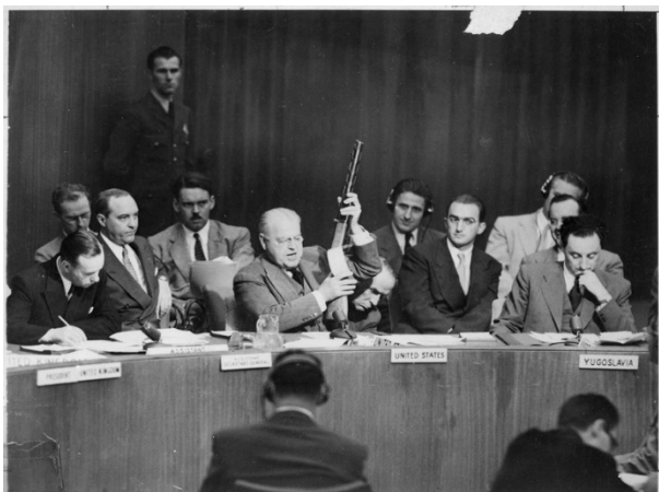
Постпред США при ООН У. Остин, демонстрирует автомат ППШ, на заседании Совета безопасности ООН в качестве доказательства советского участия в корейской войне. 18.09.1951 г.