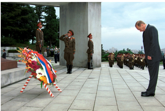
Президент России В. Путин возлагает цветы к монументу Советской Армии во время визита в Северную Корею. Пхеньян, 20.07.2000 г.

Советские «добровольцы» появлялись и в Сирии. В 1956 году они принимали непосредственное участие в боевых действиях на сирийско-израильском фронте, а также и в последующих горячих событиях: 5-13 июня 1967 (6-дневная война), в марте-июле 1970 года (война на истощение), сентябрь-ноябре 1972 г. (война в воздухе), 6-24 октября 1973 (война Судного дня).