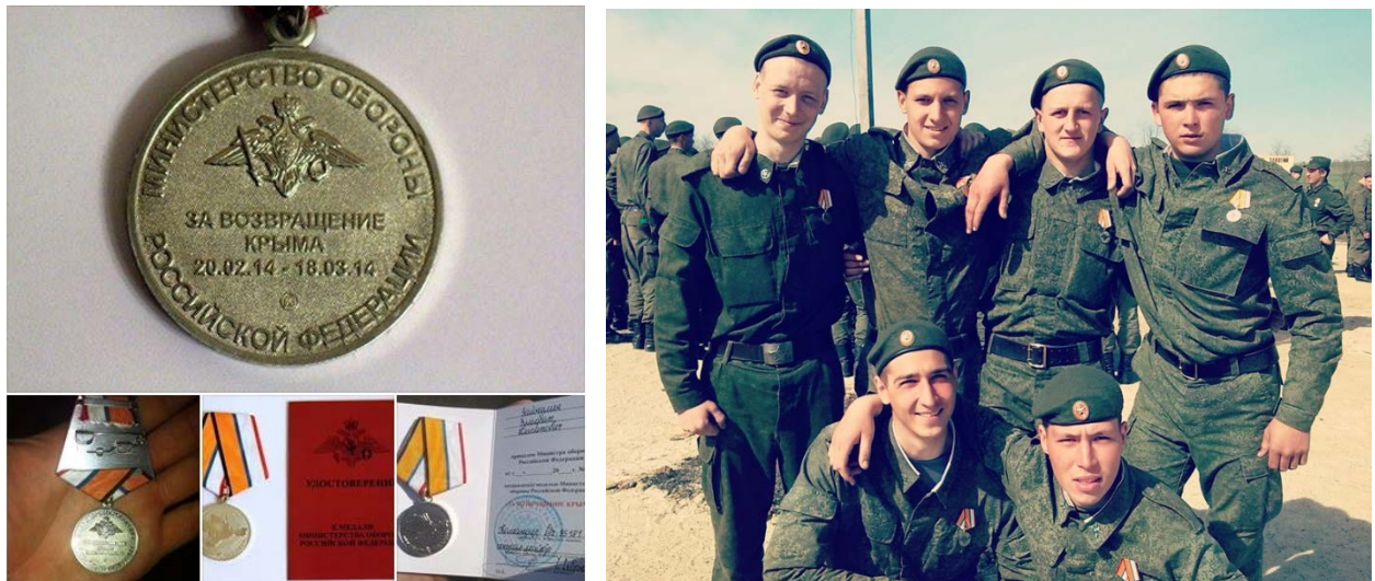
Медаль МО РФ «За возвращение Крыма» с датой начала операции 20.02.2014 г. (слева) и группа военнослужащих ВС РФ, награжденных медалью (справа)

Весьма показательными являются оценки начальника Генерального штаба Вооруженных Сил РФ Валерия Герасимова, сделанные им за год до начала Крымской кампании в своем докладе «Основные тенденции развития форм и способов применения ВС, актуальные задачи военной науки по их совершенствованию» в феврале 2013 года: «В XXI веке прослеживается тенденция стирания различий между состоянием войны и мира. Войны уже не объявляются, а начавшись – идут не по привычному нам шаблону. И сами «правила войны» существенно изменились. Возросла роль невоенных способов в достижении политических и стратегических целей, которые в ряде случаев по своей эффективности значительно превосходят силу оружия. Соотношение невоенных и военных мер 4:1». Акцент используемых методов противоборства смещается в сторону широкого применения политических, экономических, информационных, гуманитарных и других невоенных мер. К новым формам и способам ведения войны относится «снижение военно-экономического потенциала государства поражением критически важных объектов его военной и гражданской инфраструктуры в короткие сроки» 29 .