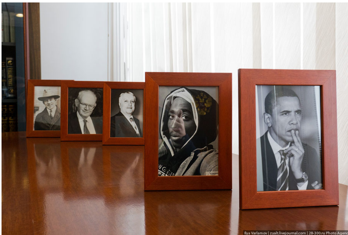
Часть кабинетных кумиров В. Суркова

Рядом находятся портреты Бенуа Мандельброта, создателя теории фракталов, исследователя объектов и систем с неупорядоченной и хаотичной структурой, а также Ильи Пригожина, разработчика концепции синергетики, исследователя энтропии и хаоса. Триада Гейзенберг – Мандельброт – Пригожин вместе с совокупным прикладным применением их наработок, дает базовый 4-тактный алгоритм нелинейных процессов, используемых для гибридных технологий ведения войны: