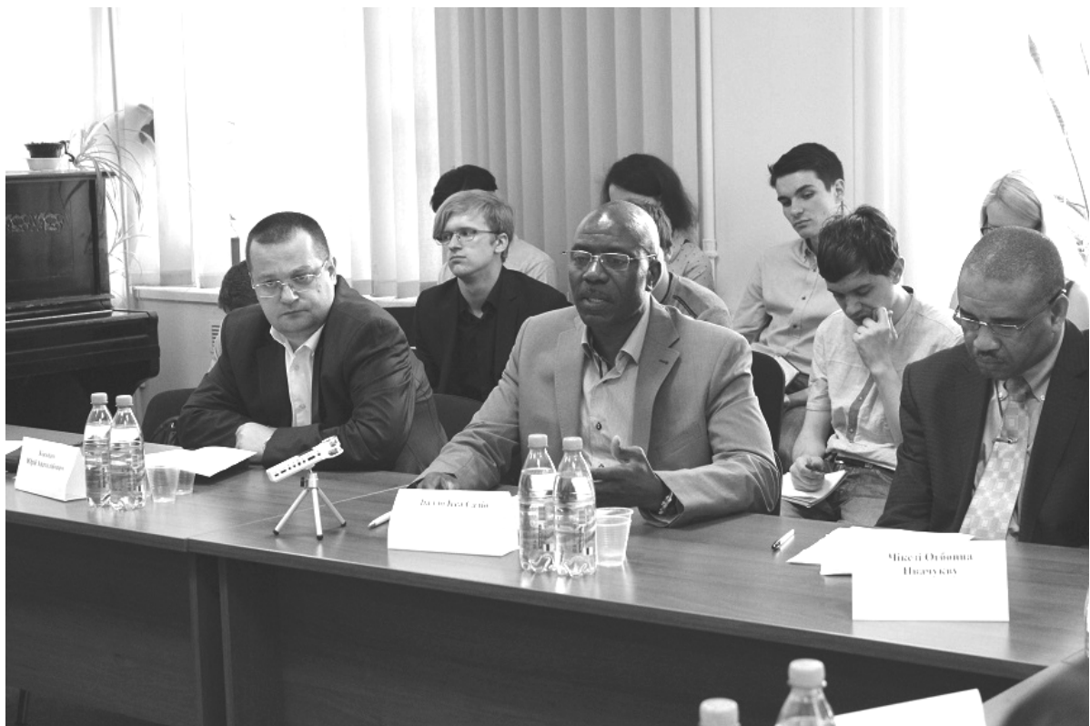
Доповідь на Пленарному засіданні Діалло Ісса Садіо, Віце-консула Гвінейської Республіки в Україні, Президента ВГО «Африканська рада в Україні»

Общественная (неправительственная) организация «Африканский Совет в Украине» предпринимает значительные усилия в этом направлении и является своеобразным «соединительным мостиком» между Украиной и Африкой, напрямую способствуя укреплению украинских позиций на рынках Африки и африканских – в Украине.