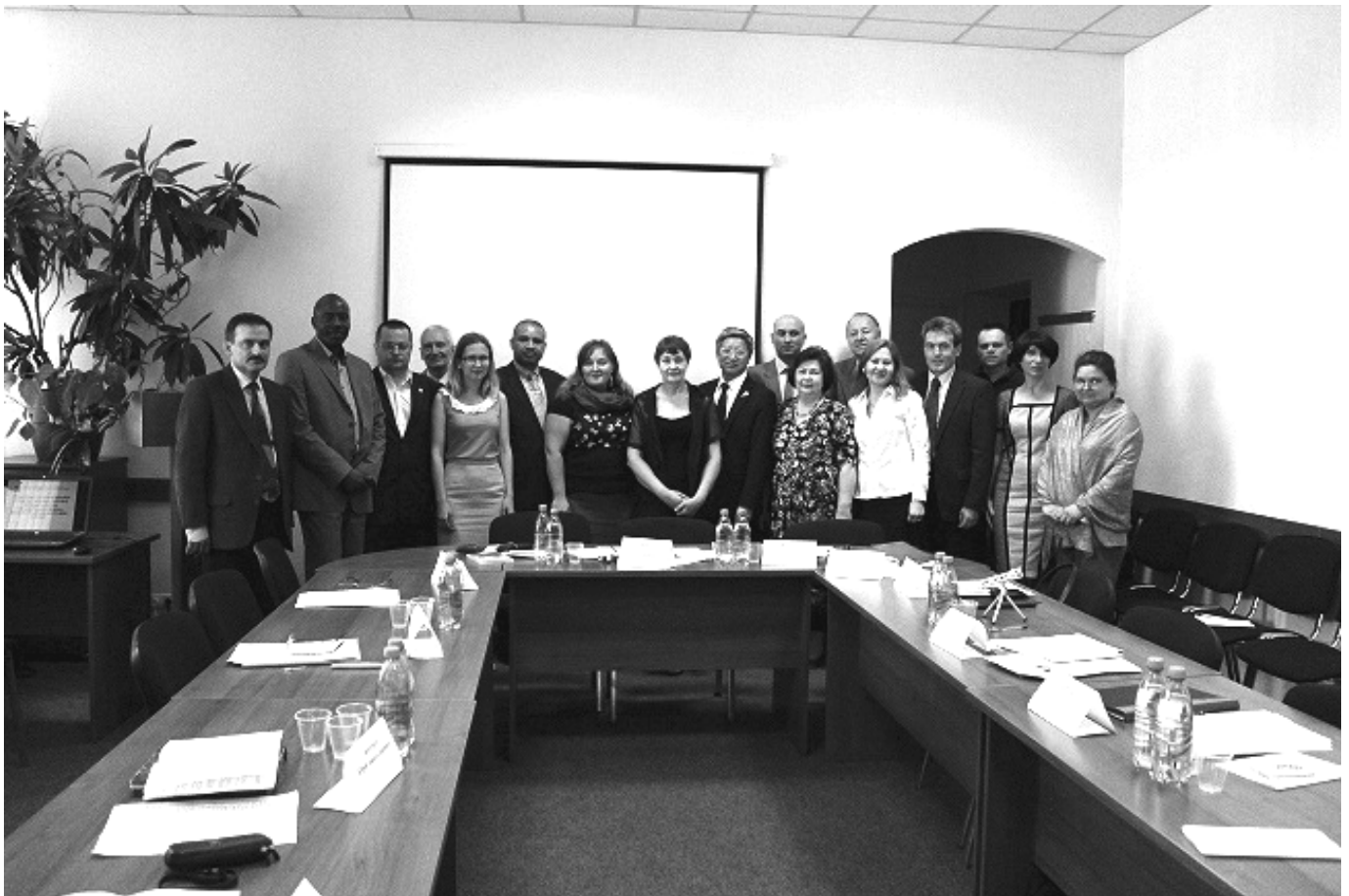
Учасники і почесні гості конференції перед відкриттям Пленарного засідання 16 червня 2016 р.

13. Городня Н.Д. Економічна дипломатія адміністрації Барака Обами: східноазійський напрям // Актуальні проблеми міжнародних відносин. – 2013. – Вип. 112, част.1 – С.188-197.