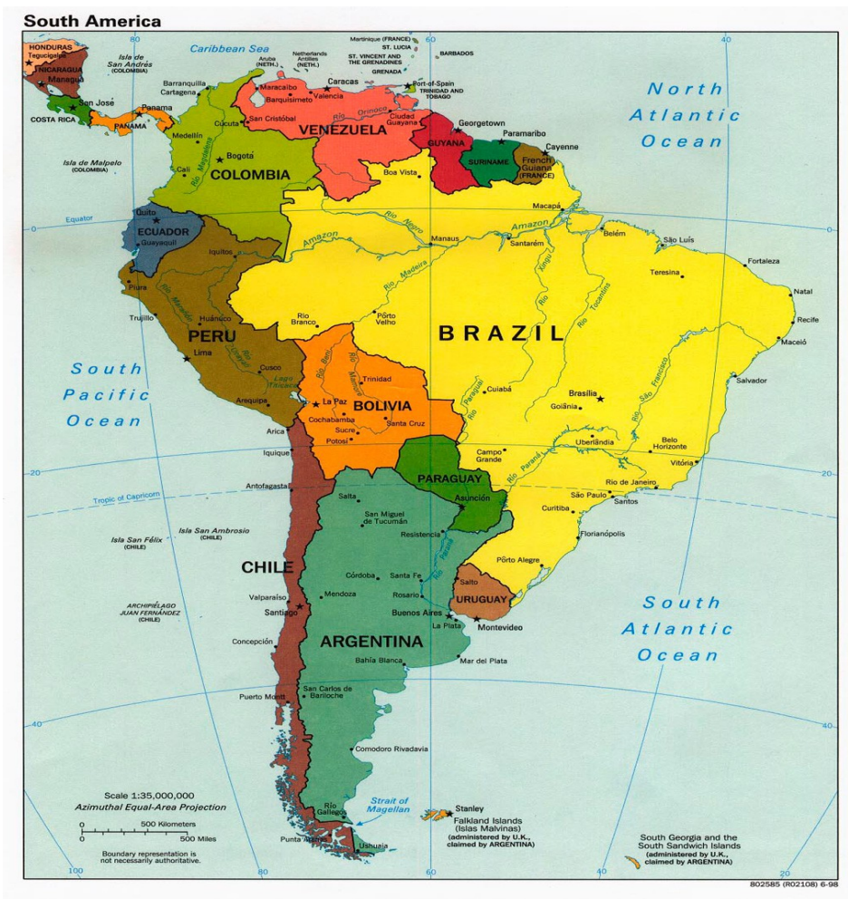
Політична карта Південної Америки