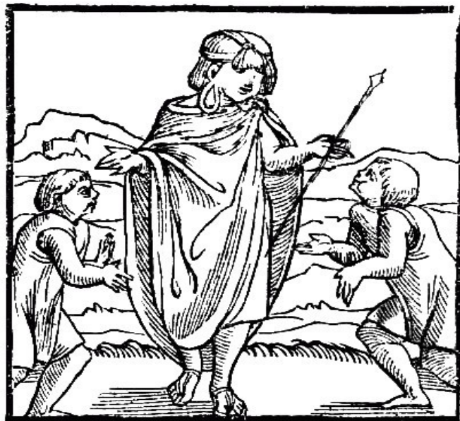
Одне з перших зображень інків у “Хроніці Перу” Педро Сьєса де Леона