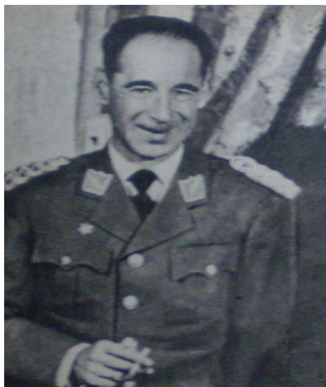
Альфредо Овандо Кандіа — керівник військової хунти в 1964 році та президент Болівії в 1969-1970 роках