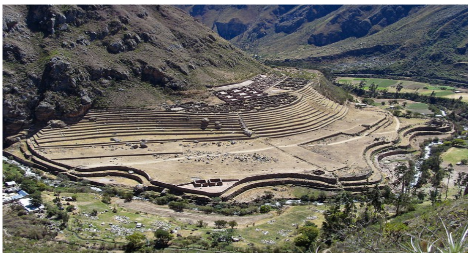
Пам'ятник архітектури інків у Болівії — Ісла-дель-Соль