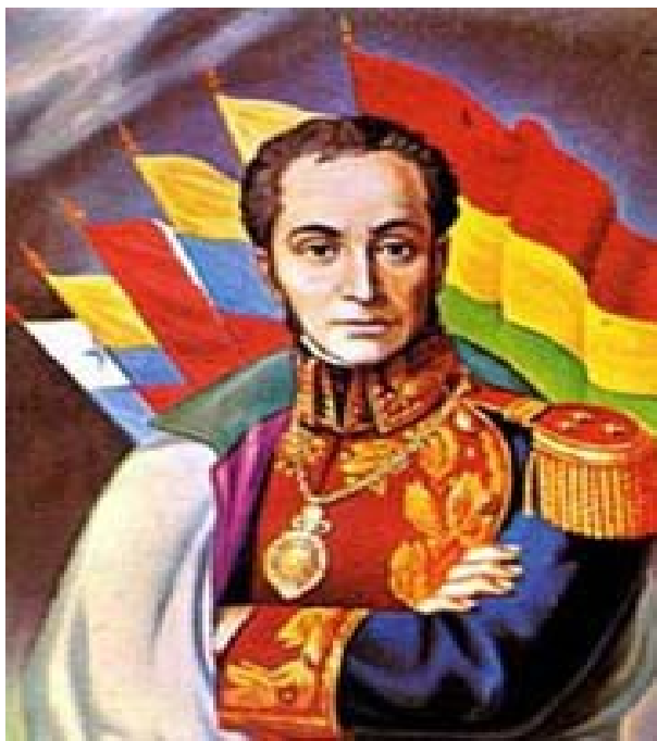
Сімон Болівар (1783-1830) — перший президент Болівії