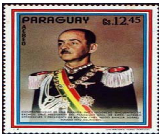
На марці зображено Уго Бансера — диктатора Болівії в 1971-1978 роках та президента в 1997-2001