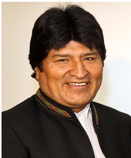
Ево Моралес — перший індіанець-президент в історії Болівії (з 2006 року)