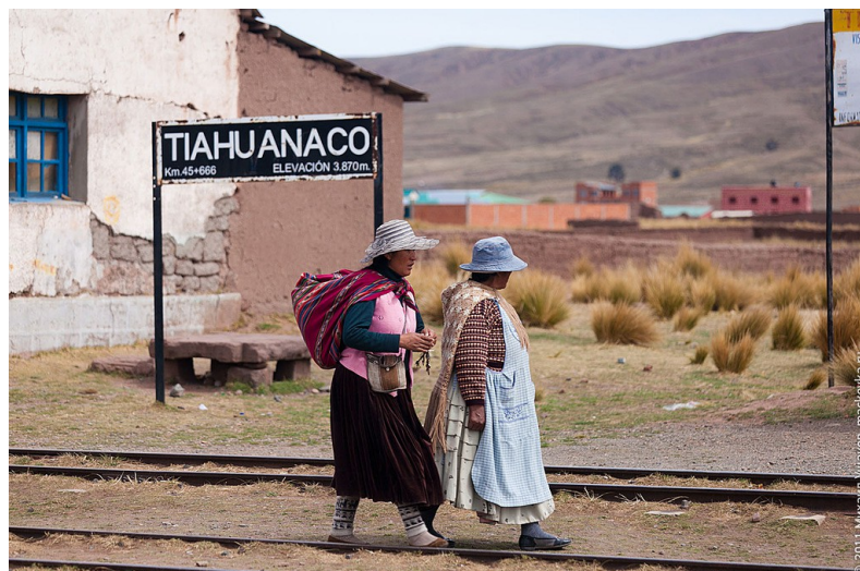
Залізнична станція в Тіуанако