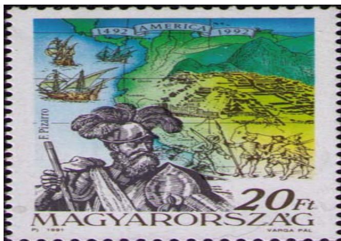
Угорська марка із зображенням Франсиско Піссаро