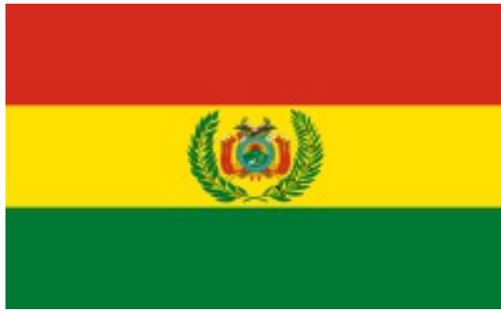
Прапор Багатонаціональної Держави Болівії