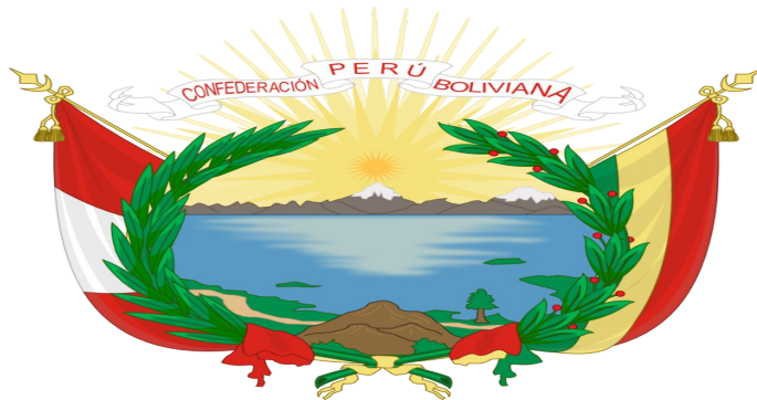
Герб Конфедерації Перу і Болівії (1836-1839)