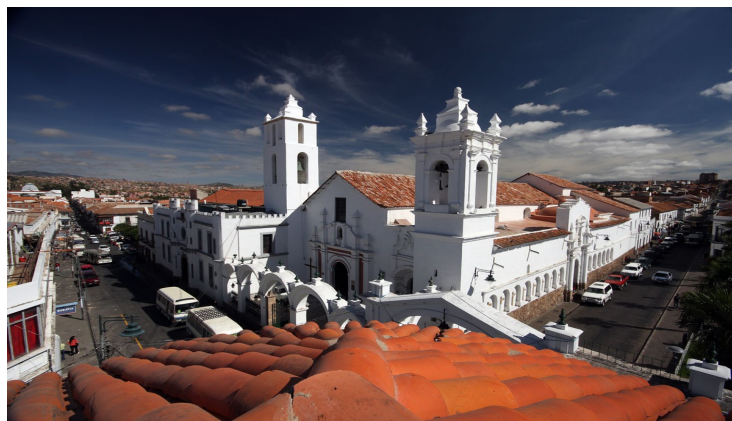
Історична частина міста Сукре