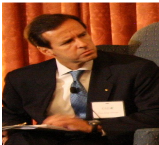
Хорхе Кірога Рамірес — 78-й президент Болівії (2001-2002)