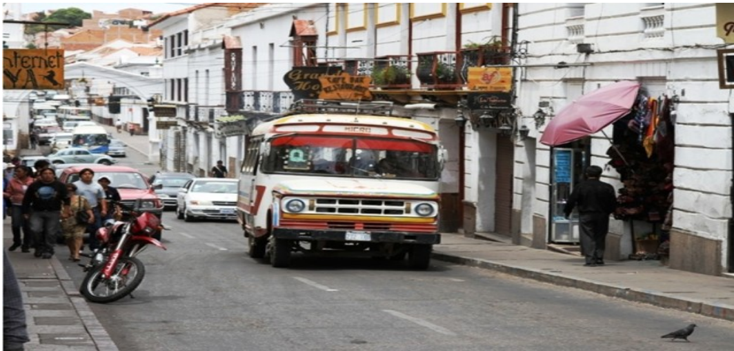
Вулиця міста Сукре