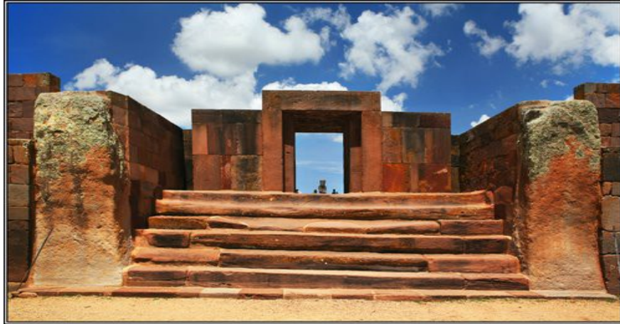
Руїни індіанського храму в Тіуанако