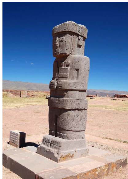
Статуя індіанського божества в Тіуанако