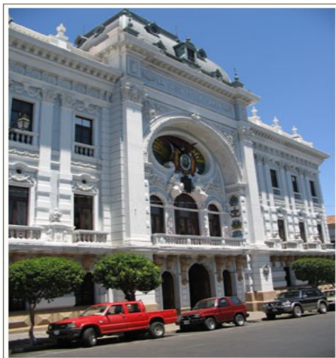
Префектура міста Сукре

після набуття чинності Закону про децентралізацію.