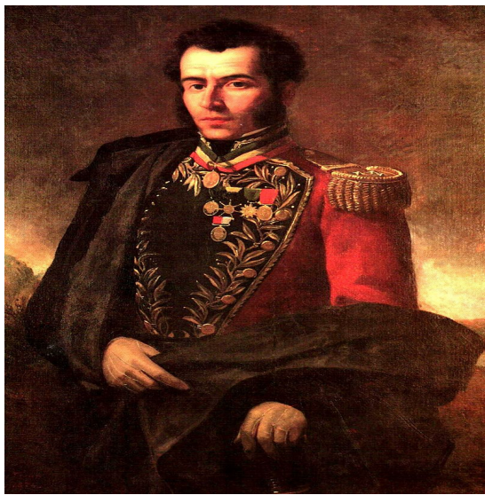
Антоніо Хосе де Сукре (1795-1830) — другий президент Болівії